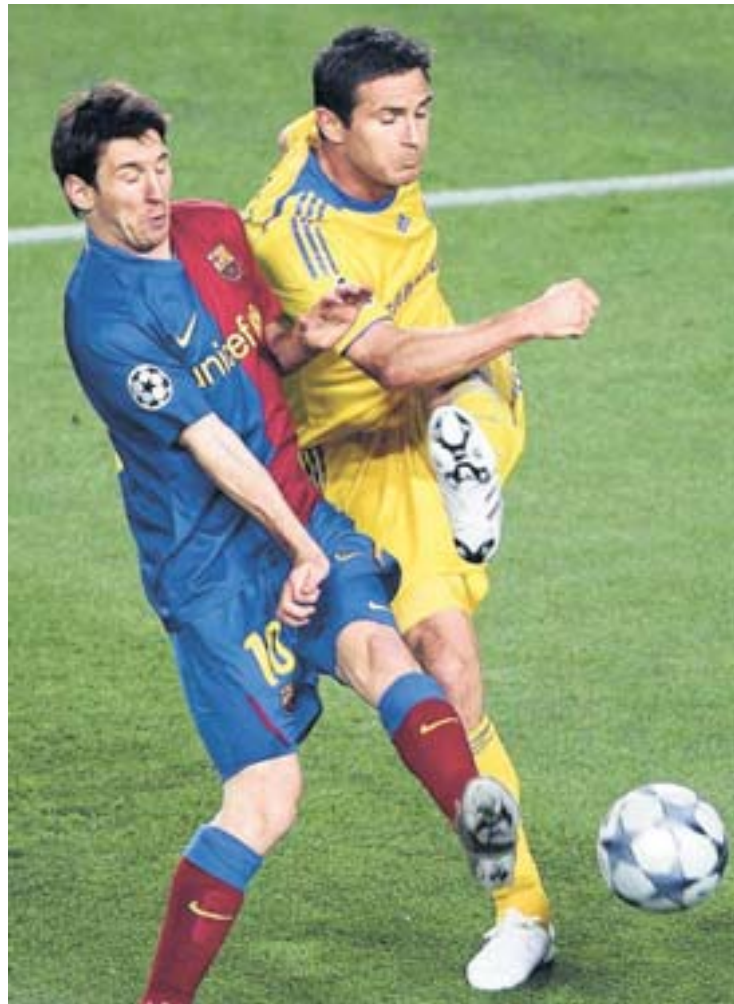
Und weg damit: Chelseas Frank Lampard stoppt Barcelonas Lionel Messi, die Briten holten ein 0:0. Mit Einsatz und Kompaktheit könnte auch Borussia heute beim FC Bayern München bestehen.