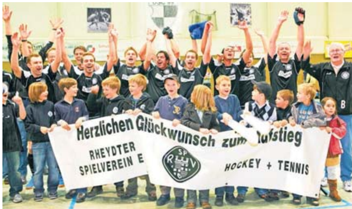
Siegesfeier: Noch auf dem Platz gratulierte der Hockey-Nachwuchs des RSV mit einem großen Transparent der Mannschaft zum Aufstieg in die Erste Bundesliga. Rund 300 Fans hatten das Team unterstützt.

„Im Unterbewusstsein war uns allen klar, dass wir das packen. Und es ist perfekt gelaufen“, freute sich RSV-Kapitän Gräber. Allerdings bereitete der Gastgeber den Rheydtern zu Beginn einige Probleme. Dafür war jedoch Torwart Marcin Pobuta gleich auf dem Posten. „Das