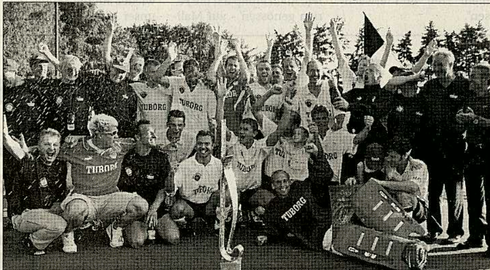
Der Deutsche Pokalsieger 2001: Rheydter Spielverein.

chenende muss der Spielverein wieder alle Kräfte mobilisieren. Dann startet die Bundesliga nach ihrer zweimonatigen Sommerpause. Und die Rheydter haben als Tabellenfünfter alle Chancen, sich für die Play-Offs zu qualifizieren. Die Samstag-Aufgabe beim Vorletzten Rot-Weiß Köln dürfte die leichtere sein. Denn tags darauf will sich der Club an der Alster für die Pokalpleite revanchieren wollen.