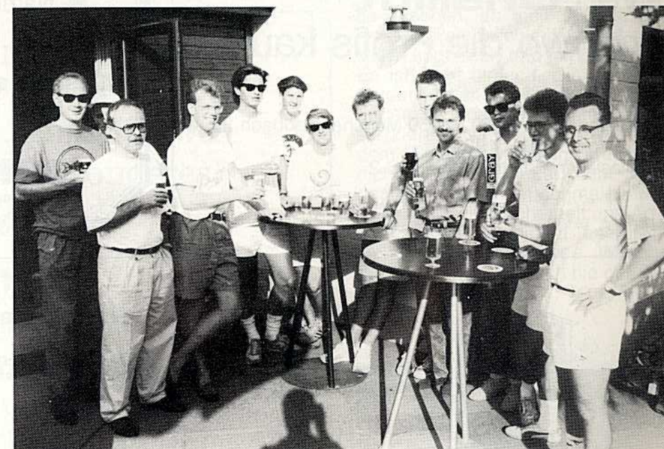
Gute Laune nach dem 4:0-Sieg gegen den THC Mettmann.

In den nächsten Wochen stehen folgende Spiele an: Sonntag, 19.8.90, 11 Uhr Bonner THV II – RSpV Samstag, 25.8.90, 15.00 Uhr RSpV – RW Berg.-Gladbach Sonntag, 2.9.90, 10 Uhr RTHC Leverkusen – RSpV Sonntag, 9.9.90, 12 Uhr DSD Düsseldorf – RSpV Samstag, 15.9.90, 15 Uhr RSpV – BW Köln II