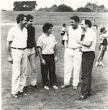
Die Lenker der Jugendabteilung

Am Sonntag, 22. 9. 1985 spielt unsere 1. Hockey-Mannschaft um 11.00 Uhr auf der „Alm“ ihr letztes, vielleicht entscheidendes Heimspiel um den Erhalt der zweithöchsten deutschen Spielklasse gegen den HC Aachen. Die junge Mannschaft würde sich über Ihren Besuch freuen.