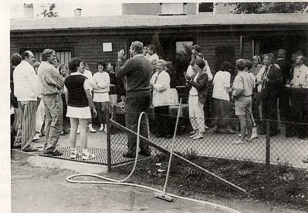
Viel Stimmung beim Thekenlied